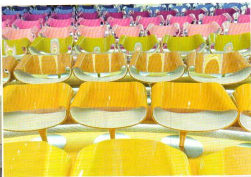
FRÖHLICHE SCHMETTERLINGE: So sehen die Architekten die „Perillos“ von Züco.